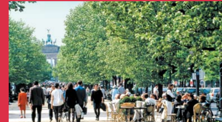
Straßencafé Unter den Linden

Hohe Lebensqualität in einer lebensoffenen, grünen Stadt. Berlin ist kosmopolitisch und bietet viel Platz für die Verwirklichung unterschiedlichster Lebensentwürfe.