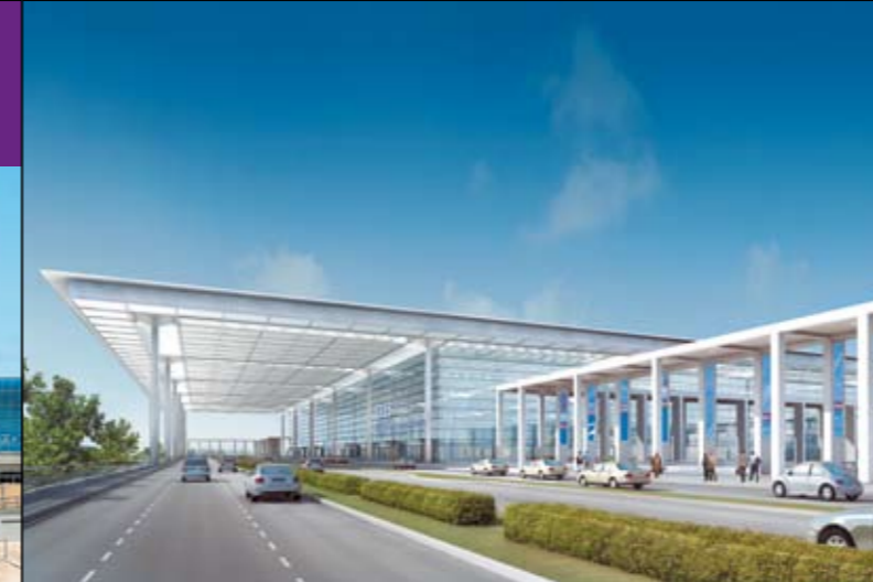
Airport Berlin Brandenburg International BBI

Als größtes Infrastrukturprojekt der nächsten Jahre in Ostdeutschland entsteht bis 2011 der Hauptstadt-Airport Berlin Brandenburg International BBI auf einer Fläche von 1.470 ha. Ein eigener Autobahnanschluss und ein überregionaler Bahnhof direkt unter dem Terminal garantieren eine schnelle Anbindung an die Hauptstadt. 6.500 Passagiere werden stündlich auf dem BBI starten oder landen. Hochinnovative Wärmerückgewinnungs- und regenerative Energiesysteme gewährleisten eine optimale Energienutzung auf dem neuen Großflughafen.