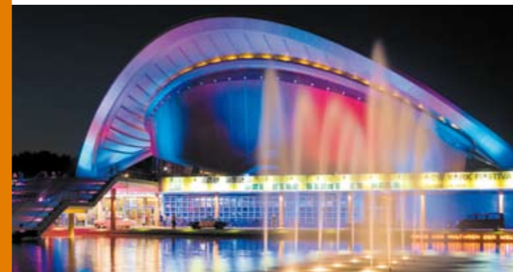
Haus der Kulturen der Welt

Die Metropole Berlin strahlt eine besondere Faszination aus. Das Neben- und Miteinander namhafter Institutionen und einer vitalen Off-Szene charakterisieren die besondere Dynamik der Berliner Kultur. Keine andere deutsche Stadt bringt so viele Ideen hervor und zieht so viele Künstler und Kreative an. Täglich bietet der Berliner Kalender unzählige Veranstaltungen. Jedes Jahr besuchen über 12 Millionen Menschen die Berliner Museen. Die Aufführungen der Berliner Bühnen sehen jährlich 2,8 Millionen Zuschauer. Höchstes Ansehen genießt auch die Museumsinsel mit ihren fünf hochkarätigen Sammlungen. Bei Besuchern besonders beliebt sind die Lange Nacht der Museen, die Internationalen Filmfestspiele Berlin, der Karneval der Kulturen, die Fête de la Musique und der Christopher Street Day.