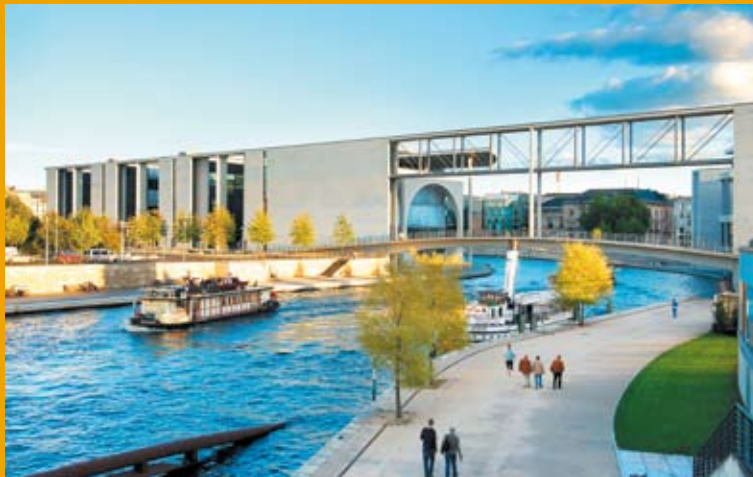
Marie-Elisabeth-Lüders-Haus im Regierungsviertel