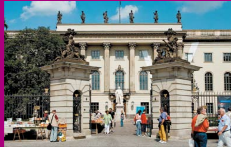
Humboldt-Universität zu Berlin