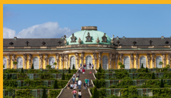
Schloss Sanssouci in Potsdam

Berlin-Brandenburg bietet passgenaue Förderprogramme für Innovationen, Investitionen und Fachkräftequalifizierung. Die Finanzierung erfolgt durch die Europäische Union, den Bund sowie die Länder Berlin und Brandenburg.