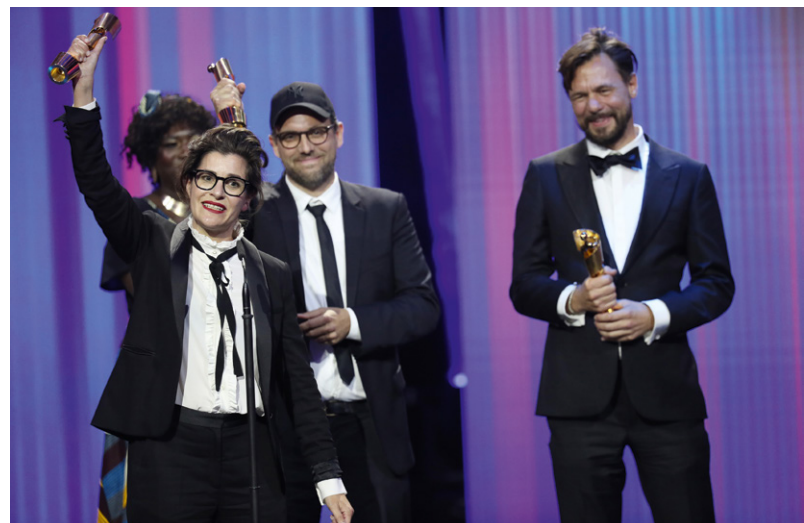
Verleihung des Deutschen Filmpreises 2021

Der Verein Virtual Reality Berlin-Brandenburg (VRBB), der u. a. die VR Now Awards organisiert, vernetzt die regionalen Akteure in den Bereichen VR, AR und XR.