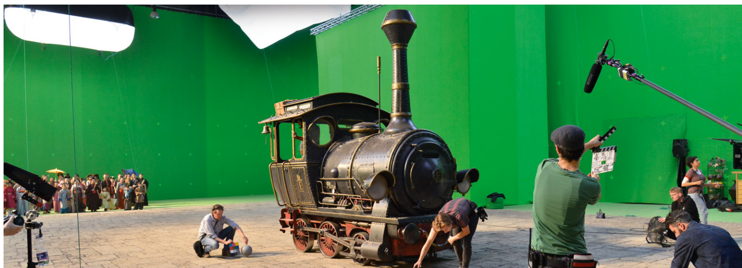
Dreharbeiten im Studio Babelsberg

Ergänzend bieten die vielen erstklassigen Dienstleister wie cine+ oder Rotor Film und renommierte Spezialisten aus den Bereichen Post-Produktion oder visuelle Effekte wie RISE, Trixter oder Baby Giant Hollyberg, ebenso wie Anbieter für Kulissenbau oder Casting optimale Bedingungen für aufwendige Produktionen.