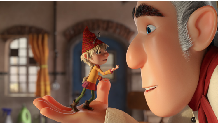
„Die Heinzels – Rückkehr der Heinzelmännchen“, Akkord Film Produktion