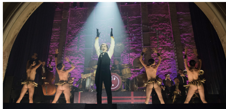
„Babylon Berlin“, X Filme

Produktionen wie z. B. „Dark“, „Unorthodox“, „München – Im Angesicht des Krieges“, „Das Damengambit“ oder aktuell die Mystery-Serie „1899“ der „Dark“-Macher mit einer virtuellen Stage in Babelsberg sprechen für sich. Großartige Locations und die international erfahrenen Filmschaffenden aller Gewerke machen die Region für uns, aber auch für andere Streamer, Studios und Filmproduktionen zu einer der attraktivsten weltweit.