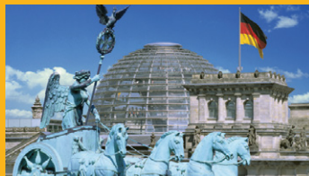
Quadriga vor der Reichstagskuppel