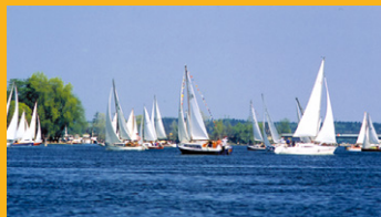
Hervorragende Freizeitmöglichkeiten in der Region

Die Region verbindet auf unvergleichliche Weise das internationale Flair der Metropole Berlin mit der faszinierenden Natur und den historischen Sehenswürdigkeiten Brandenburgs. Eine einmalige Clubszenen, renommierte Großveranstaltungen, mehr als 170 Museen, 150 Bühnen sowie rund 500 Schlösser, Kirchen und Parkanlagen laden zum Besuch ein. Sportlichen Freizeitaktivitäten wie Golf, Reiten, Wassersport und Fliegen sind keine Grenzen gesetzt.