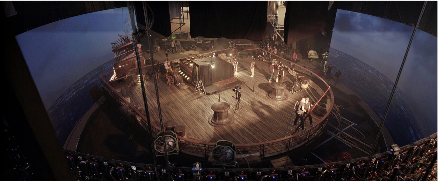
„1899“, Dark Bay Virtual Production Stage